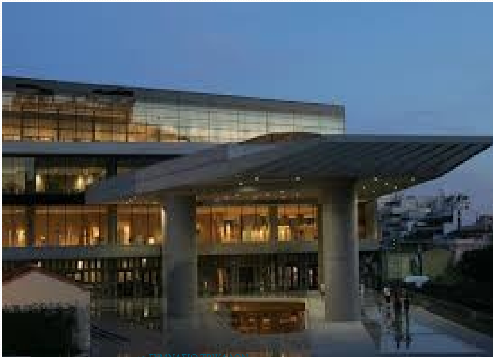
30 ΓΥΜΝΑΣΙΟ ΤΡΙΚΑΛΩΝ