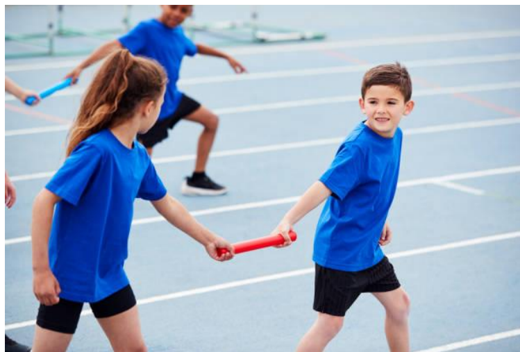
Σύγχρονη φωτογραφία από σχολική σκυταλοδρομία: Η σκυταλοδρομία είναι το απόλυτο σύμβολο συνεργασίας, καθώς η νίκη εξαρτάται από την ομαλή παράδοση της σκυτάλης.

Παράλληλα, η συνεργασία ήταν εξίσου σημαντική. Παρόλο που πολλοί αγώνες ήταν ατομικοί, η προετοιμασία των αθλητών και η συμμετοχή τους στη διοργάνωση βασίζονταν στην ομαδικότητα και την υποστήριξη. Στο σχολικό περιβάλλον, η συνεργασία φαίνεται μέσα από τις ομαδικές εργασίες, την αλληλοβοήθεια και τον σεβασμό στις διαφορετικές απόψεις. Όταν δουλεύουμε μαζί, μπορούμε να πετύχουμε καλύτερα αποτελέσματα και να δημιουργήσουμε ένα θετικό κλίμα.