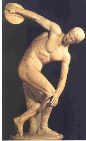
Το Άγαλμα του Δισκοβόλου του Μύρωνα: Ανάδειξη της τελειότητας και της αρμονίας του σώματος και του πνεύματος

Επιπλέον, η αξία του « Eu Αγωνίζεσθαι » αποτελεί τον συνδετικό κρίκο μεταξύ αρχαιότητας και παρόντος. Στην αρχαία Ολυμπία, η παραβίαση των κανόνων θεωρούνταν ύβρις και προσβολή προς το θείο. Σήμερα, η τήρηση των κανόνων στο σχολικό παιχνίδι ή στις εξετάσεις δεν είναι απλώς μια υποχρέωση, αλλά μια πράξη αυτοσεβασμού. Όταν συνεργαζόμαστε για ένα ομαδικό project, η επιτυχία δεν ανήκει στον πιο «δυνατό» της ομάδας, αλλά στον τρόπο με τον οποίο ο ένας συμπληρώνει τις αδυναμίες του άλλου.