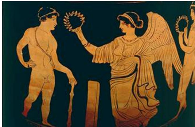
Απονομή Κότινου (στεφανιού ελιάς): Συμβολίζει ότι η ηθική ανταμοιβή και η δόξα είναι σημαντικότερες από τα υλικά αγαθά

Είναι απόλυτα σαφές ότι οι αξίες του αρχαίου αθλητισμού παραμένουν πιο επίκαιρες από ποτέ, καθώς ο υγιής συναγωνισμός και η ειλικρινής συνεργασία δεν αποτελούν απλώς θεωρητικές έννοιες, αλλά τα απαραίτητα «εργαλεία» για να οικοδομήσουμε έναν καλύτερο εαυτό και μια πιο δεμένη σχολική κοινότητα. Τα μαθήματα από τους αρχαίους αγώνες είναι πολύτιμα για το σχολείο μας σήμερα, αφού μας διδάσκουν έμπρακτα ότι η πραγματική επιτυχία δεν μετριέται αποκλειστικά με τη νίκη, αλλά κυρίως με την επίμονη προσπάθεια, τη σωστή συμπεριφορά και τη στάση σεβασμού απέναντι στους άλλους. Σε αυτό το πλαίσιο, η πρόοδος του ενός γίνεται πηγή έμπνευσης για όλους, καθώς ο συναγωνισμός μάς ωθεί διαρκώς να εξελισσόμαστε ατομικά, ενώ την ίδια στιγμή η συνεργασία μάς βοηθά να προχωράμε μαζί, διασφαλίζοντας ότι κανείς δεν μένει πίσω στην κοινή μας πορεία προς τη γνώση και το ήθος.